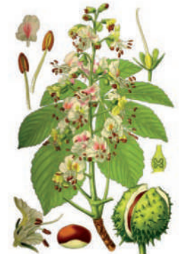
Aesculus hippocastanum L. Ιπποκαστανιά