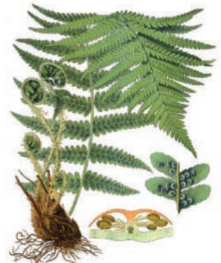
Dryopteris filix-mas (L.) Φτέρη