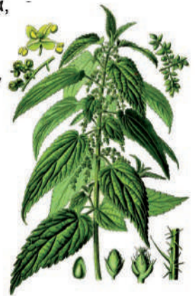
Urtica urens L. - Urtica dioica L. Τσουκνίδα

Η χρήση του Natural Wax έχει επίσης ως αποτέλεσμα την ενίσχυση του ελάσματος των φύλλων, πιο λαμπρή όψη των καρπών, μια φυσική αντοχή έναντι επιβλαβών παρασίτων και μεγαλύτερη αντοχή στο βιοτικό και αβιοτικό στρες. Είναι επομένως ένα εξαιρετικό "Συnergιστικό" προϊόν, όταν χρησιμοποιείται σε συνδυασμό με φυτοπροστατευτικά προϊόντα τα οποία χρησιμοποιούνται με διαφυλλικούς ψεκασμούς, ενισχύοντας έτσι την αποτελεσματικότητά τους.